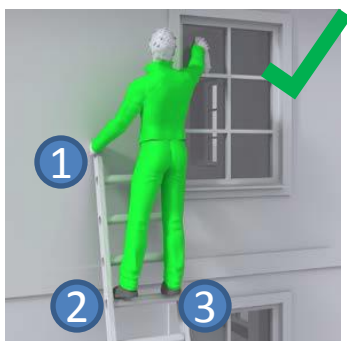
G.d: 3 Points Contact