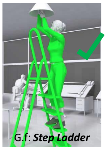
G.f: Step Ladder