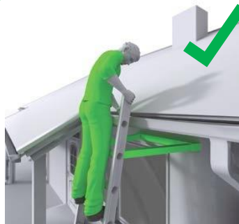
G.e: Tidak berada di 3 anak tangga di atas