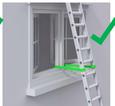
G.c: Tangga di ikat