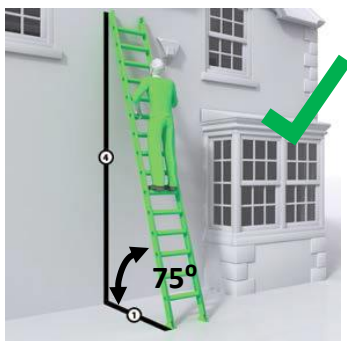
G.a: 1 in 4 Rule